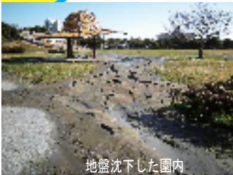
地盤沈下した園内 2011年3月12日撮影