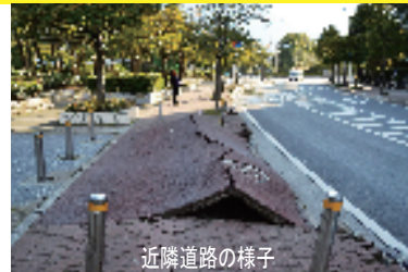
近隣道路の様子 2011年3月11日撮影